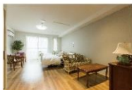
明るく心地よい居室空間