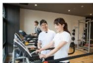
メリィ・メディカルフィットネス