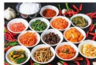
高麗カフェ&美膳料理